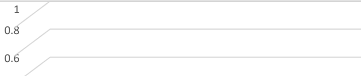
Solicitudes recibidas via correo electronico