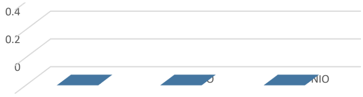
Solicitudes de información recibidas en formato físico