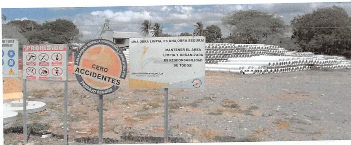
Ilustración 2: Almacenamiento de suministros de Tuberías