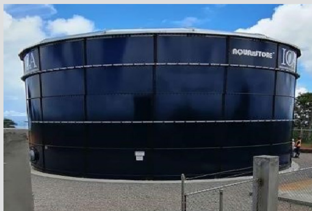
Acueducto Juana Vicenta