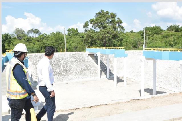
Planta de tratamiento de aguas residuales de Barahona

Se prevé que el año 2022 será de grandes logros en el renglón de agua potable y saneamiento (APS), debido al apoyo del presidente Luis Abinader.