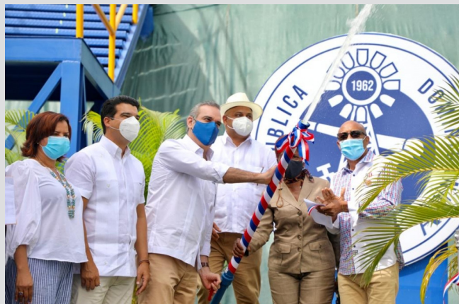
Planta potabilizadora Guanuma - Los Botados

Estas obras acercan al INAPA al cumplimiento del compromiso del presidente Luis Abinader de suministrar agua potable y saneamiento a cada hogar dominicano.