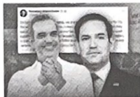
Marco Rubio y Luis Abinader

dos Unidos, agradecemos al presidente Abinader su amistad y su disposición a ser anfitrión de la Cumbre de las Américas. Apoyamos plenamente la decisión de posponer la cumbre y seguiremos colaborando con la República Dominicana y otros países de la región pa-