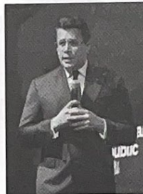
Ministro David Collado.

"El turismo es desarrollo, turismo es economía, turismo es bienestar, turismo es alegría", expresó Collado, resaltando la preparación de la