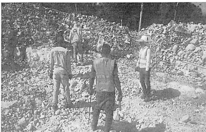
Movimiento de tierra area deposito regulador