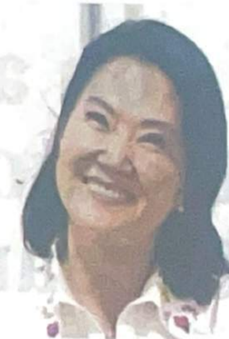
Keiko Fujimori se mantiene ganadora con ligera ventaja.